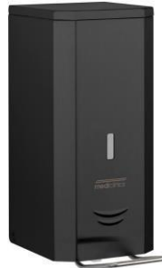
DJP0034B Mattschwarzes Epoxyd