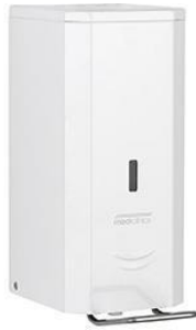
DJP0034 Weißes Epoxyd