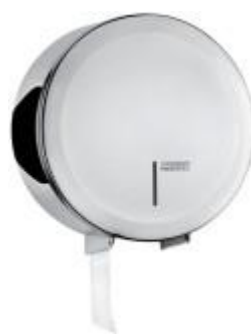
PR2783C Glänzende Oberfläche