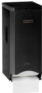
PR2784B Schwarzes Epoxyd