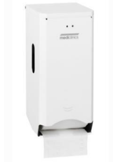
PR2784 Weißes Epoxyd