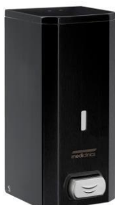
DJ0031B Mattschwarzes Epoxyd