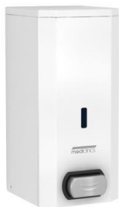
DJ0031 Weißes Epoxyd