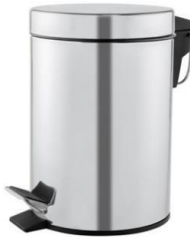
PP1303C/PP1305C/PP1312C/ PP1321C Glänzend