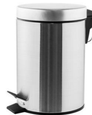
PP1303CS/PP1305CS/PP1312CS/ PP1321CS Satiniert