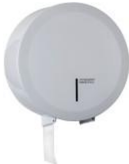
PR2787 Weißes Epoxyd