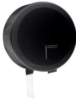
PR2787B Schwarzes Epoxyd