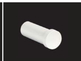
Handtaschen- und Mantelhaken SF-568