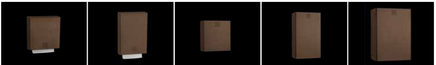
Papierhandtuchspender ca. 550 Blatt - BR-100