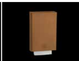
Papierhandtuchspender ca. 800 Blatt - KU-103