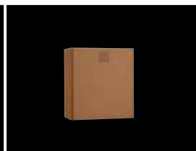
Abfallbehälter ca. 14L KU-230