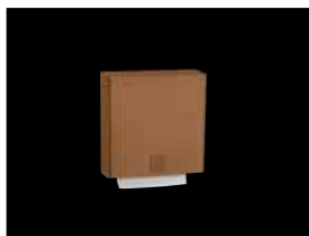
Papierhandtuchspender ca. 550 Blatt - KU-100