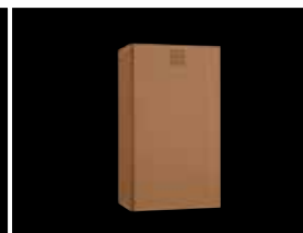
Abfallbehälter ca. 31L KU-200