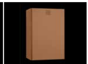
Abfallbehälter ca. 60L KU-245