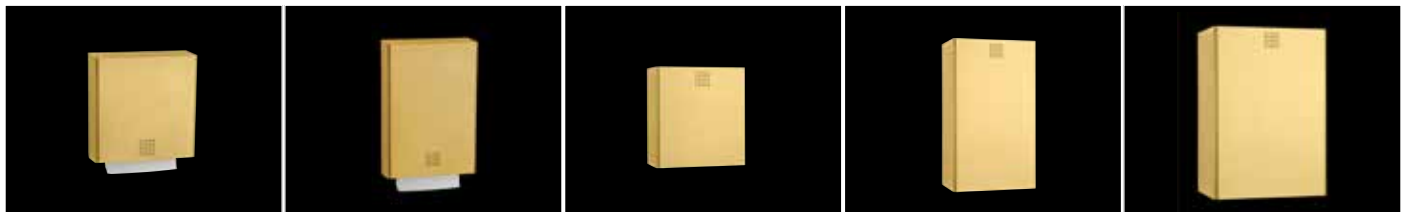
Papierhandtuchspender ca. 550 Blatt - ME-100