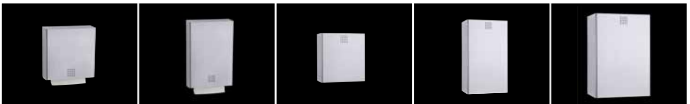
Papierhandtuchspender ca. 550 Blatt - PU-100