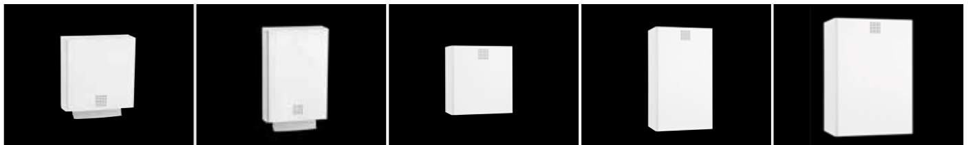
Papierhandtuchspender ca. 550 Blatt - SF-100